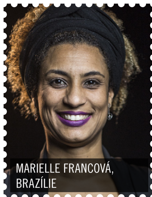
MARIELLE FRANCOVÁ, BRAZÍLIE