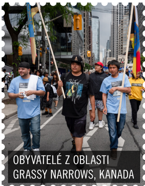
OBYVATELÉ Z OBLASTI GRASSY NARROWS, KANADA

Při jednom z protestů ji zadržela policie. Za pouhé pořádání pokojných protestů jí hrozil až devítiletý trest ve vězení. O rok později soud stáhl všechna obvinění. Během Maratonu psaní dopisů jí lidé z celého světa poslali přes 394 000 dopisů, e-mailů, tweetů apod.