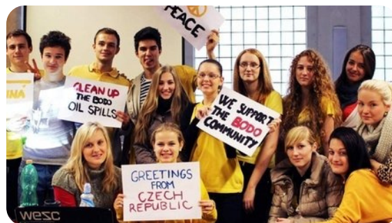
ŠKOLNÍ AMNESTY SKUPINKY, LEKTOROVÁNÍ, SEMINÁŘE A DALŠÍ...