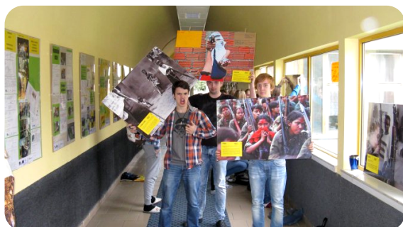
FILMY A VÝSTAVY O LIDSKÝCH PRÁVECH K ZAPŮJČENÍ