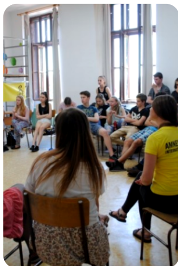
WORKSHOPY O LIDSKÝCH PRÁVECH