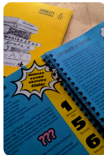
PŘÍRUČKY, METODIKY A WEBY