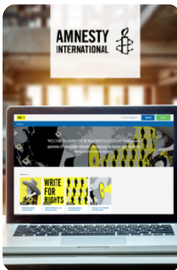
E-LEARNINGY, ONLINE KURZY A MOBILNÍ HRY